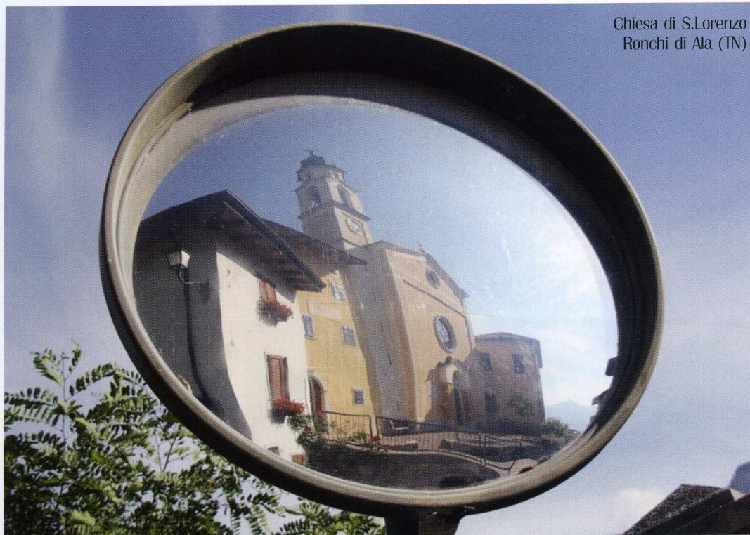
Chiesa di S.Lorenzo Ronchi di Ala (TN)

minciando a sperimentare la macrofotografia, con immagini che porterà anche in mostra.